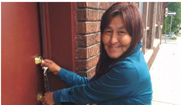
L'Armée du Salut, et les meubles offerts par The Furniture Bank (Kanata), ont contribué à ce sourire en entrant dans son propre chez-soi à l'été 2015 (Crédit: L'Armée du Salut).