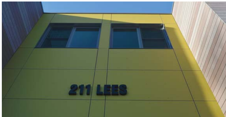
Reconstruction dans un grand ensemble sur l'avenue Lees après un incendie dévastateur en 2013

En tant que collectivité, nous pouvons mettre un terme à l'itinérance. Tout comme des ressources et des investissements ciblés peuvent mettre un terme à l'itinérance chronique, nous devons nous assurer que les interventions et les investissements soutiennent tous les groupes de sans-abri. Des investissements dans un secteur ne doivent pas se traduire par une réduction du soutien ailleurs. Comment pouvons-nous nous assurer que les communautés autochtones, les familles, les jeunes, les vétérans, les victimes de violence, les réfugiés et les immigrants, et d'autres reçoivent un soutien approprié ? Comment pouvons-nous accorder suffisamment d'attention aux services orientés vers la prévention de perte du logement pour les gens à risque ?