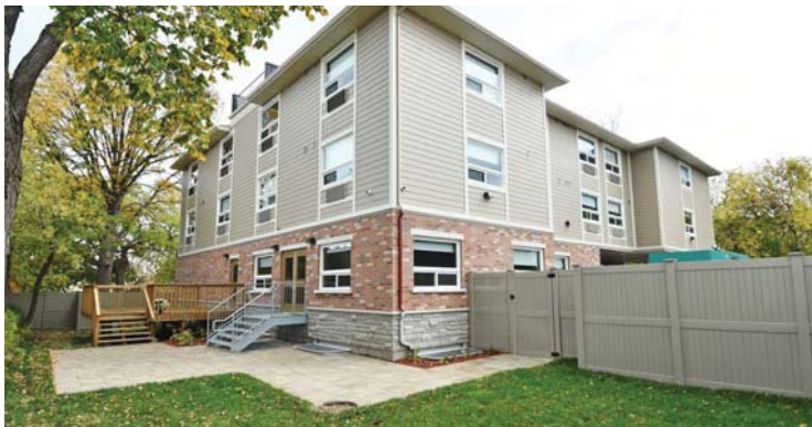
En septembre 2015, la Société John Howard a inauguré Les Logements avec soutien de la rue Gardner – un immeuble de 34 appartements offrant des services médicaux et sociaux à des hommes ayant auparavant connu une itinérance chronique.

Le progrès dépend de chacun de nous. Ni la ville d'Ottawa, ni une personne, un organisme ou un secteur ne peuvent par eux-mêmes mettre un terme à l'itinérance. Cependant, ensemble, nous pouvons faire des pas dans la bonne direction.