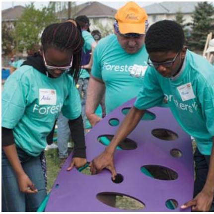
Une équipe de bénévoles et de jeunes installe des parties d'une structure de jeu avec l'aide de KaBOOM!, mai 2015